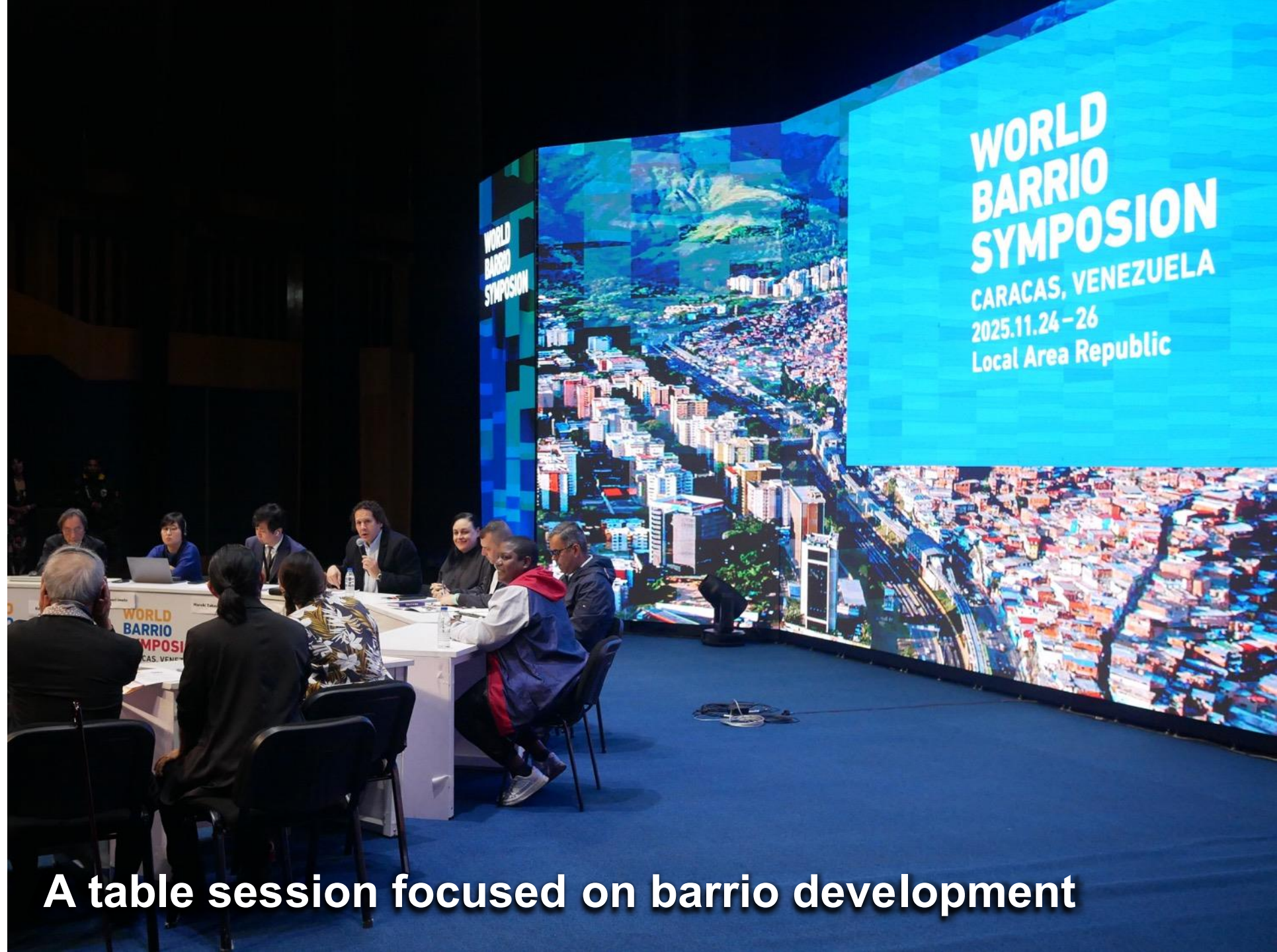
A table session focused on barrio development