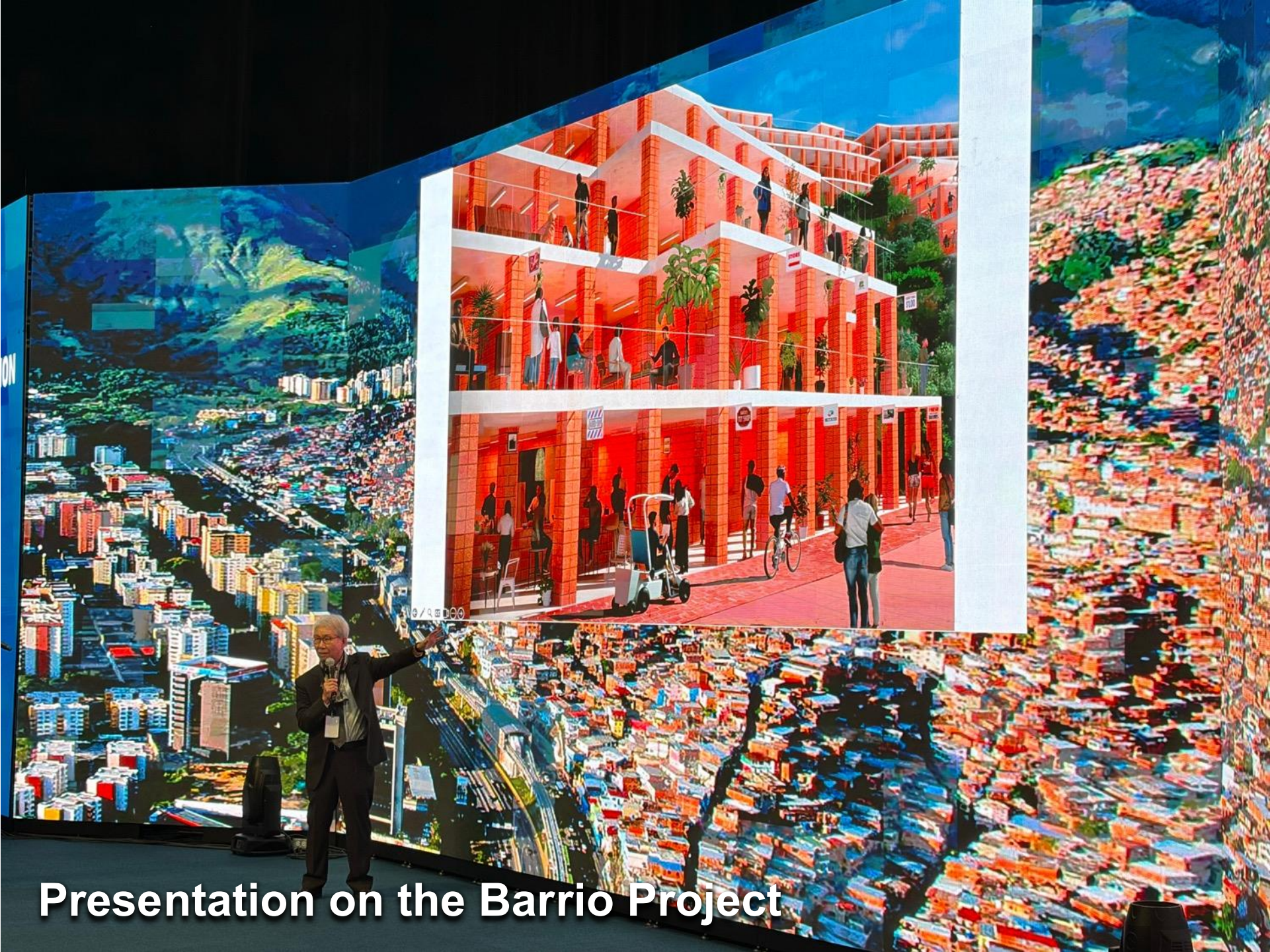
Presentation on the Barrio Project