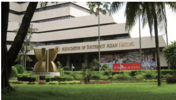
▲ASEAN事務局（インドネシア・ジャカルタ）

地域協力としてのASEANは、6億7000万人を超える人口規模で、過去10年間に高い経済成長を見せており、2030年にはASEANの総合GDPは日本のGDPを上回ると推測されています。インドネシアは現在、経済開発協力機構（OECD）の加盟を目指しています。今後、世界の「開かれた成長センター」となる潜在力が、世界各国から注目されています。