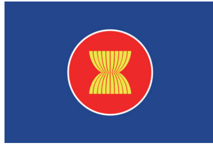
▲ASEANの旗 旗の中央のシンボルマークは、ASEAN加盟国10か国をあらわす10本の稲の茎の束を表し、友好と結束で結ばれた東南アジアのすべての国で構成されるASEANを表しています。